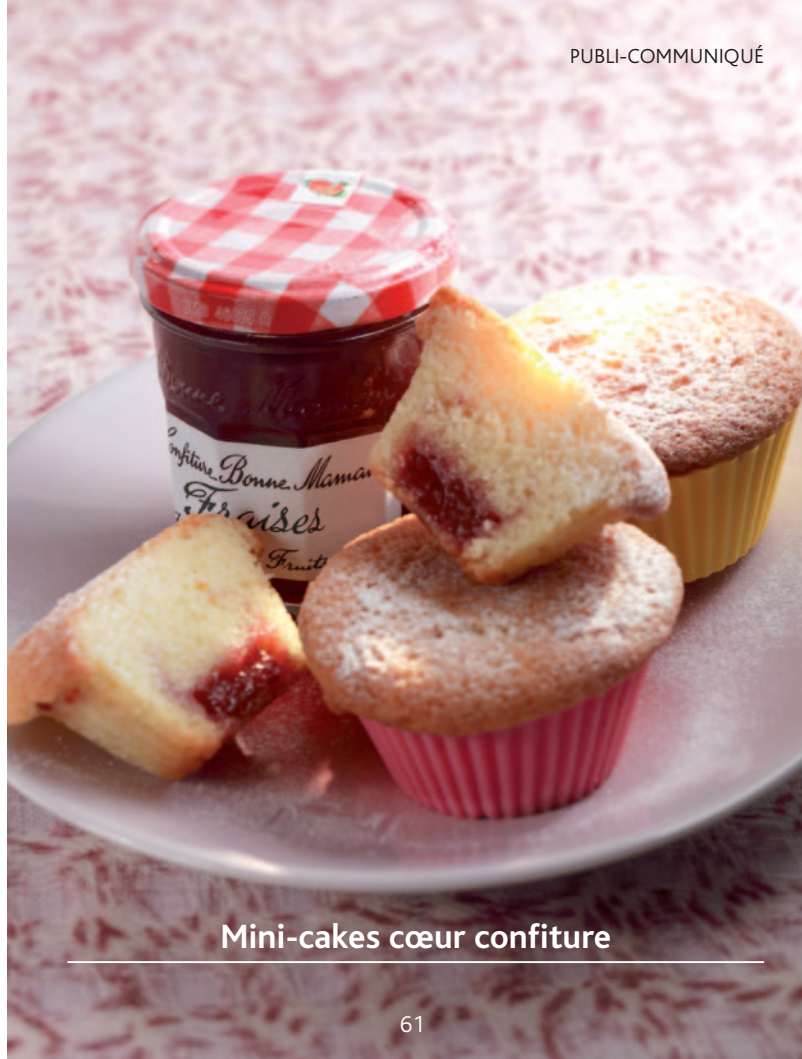
Mini-cakes cœur confiture